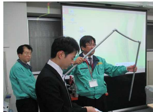
多彩な方法を用いて自社の技術を熱心に解説する発表者たち 左：ベンの社員のみなさま 右：レックス工業の社員のみなさま