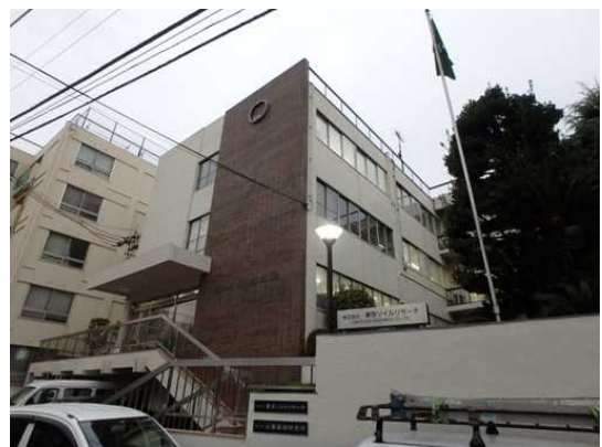
東京ソイルリサーチ本社社屋